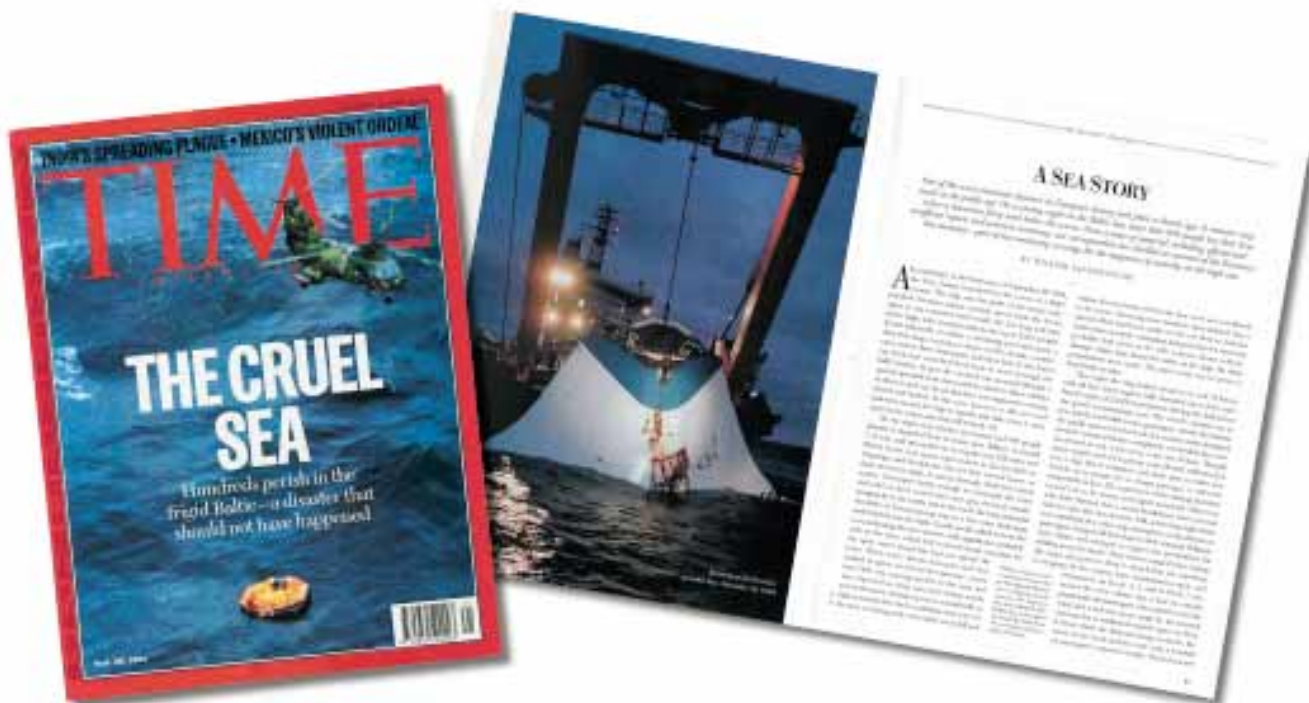
M/S Estonias förlisning har under årens lopp i hög grad uppmärksamats i internationella medier. Några exempel – med tio års mellanrum – är det amerikanska nyhetsmagasinet Time som i sin internationella edition nummer 41/1994 gav katastrofen snabbt och stort utrymme, samt den ansedda amerikanska månadstidskriften The Atlantic Monthly som i en tiosidig artikel i sitt majnummer 2004 minns katastrofen med den marinejournalisten och författaren William Langewiesche’s sammanfattning: ”One of the worst maritime disasters in European history /.../”.

Estoniasamlingen kan till mycket stora delar användas även om man endast har tillgång till en långsammare så kallad modemuppkoppling. Detta gäller t.ex. sökningar, skannade dokument och informationstexter. Självklart är en uppkoppling via så kallat bredband eller ADSL-modem att föredra, eftersom all nerladdning då går snabbare. De ljud- och videoupptagningar som kan laddas ner finns i två varianter, dels en med högre ljud- och bildkvalitet, dels en med lägre. Dessa typer av filer är till sin natur stora, varför nerladdning med vanligt modem (inte ADSL) tar mycket lång tid. ■